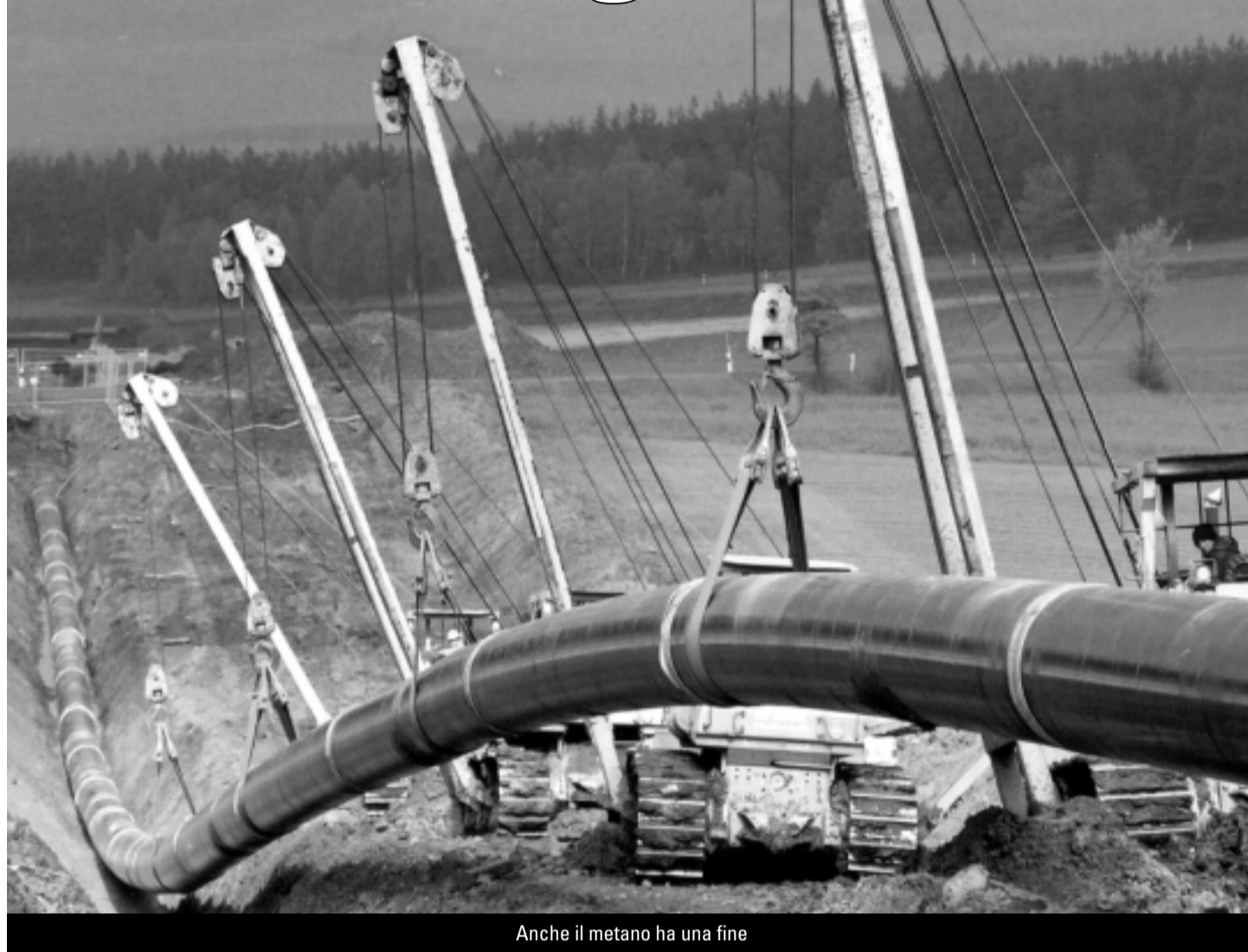
Anche il metano ha una fine

A fine agosto scade il termine entro il quale è possibile inoltrare opposizione contro la decisione dell'Ufficio federale dell'energia di autorizzare Metanord Sa, con sede a Bellinzona, a realizzare il metanodotto che da Vezia porterà il gas in tutto il Sopraceneri.